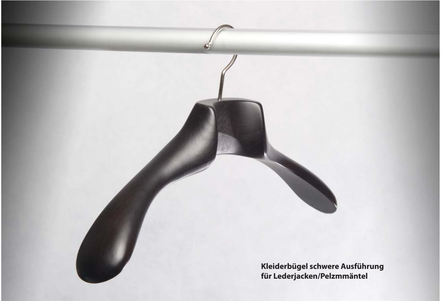
Kleiderbügel schwere Ausführung für Lederjacken/Pelzmäntel