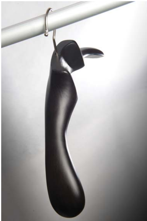
Kleiderbügel für Herrn/Unisex - Schulterbreite 45/42 cm